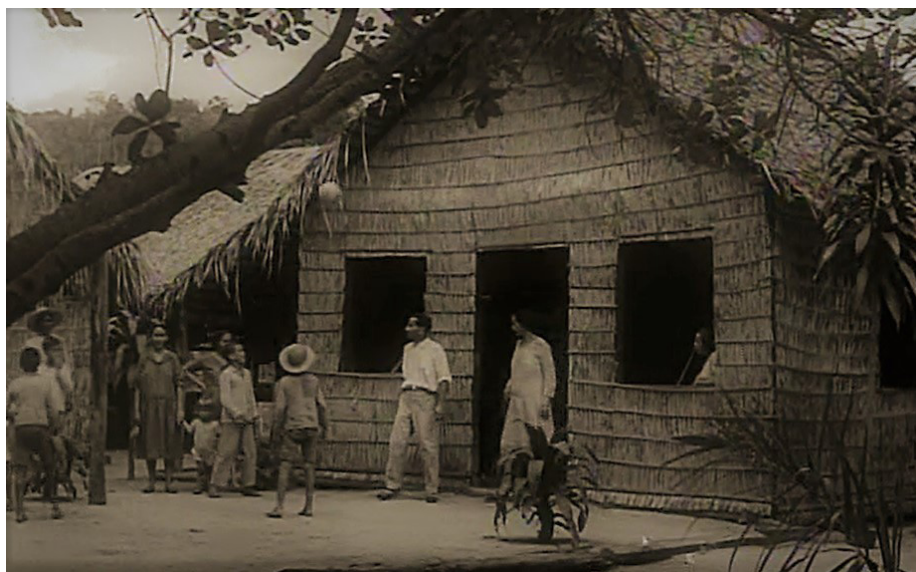
Figura 1. Casas de palha em Fordlândia e em Rurópolis

Foram três dias de ataque no desmonte da Vila da Palha, sem reação dos moradores, pois o representante do INCRA e as autoridades que comandavam a ação, tinham o 8.º Batalhão de Engenharia e Construção do Exército na retaguarda. Mortes, traumas e desalento decorrentes deste despejo violento foram encobertos, tanto pela imprensa nacional que acompanhou a Comitativa do Presidente, quanto pela memória da maioria do povo que viveu essa situação de violência. Era uma ditadura militar e o Exército liderava os preparativos para a festa de inauguração da Rurópolis. Tratores esconderam escombros dentro de uma área aberta para este fim, trabalho liderado pelo INCRA.