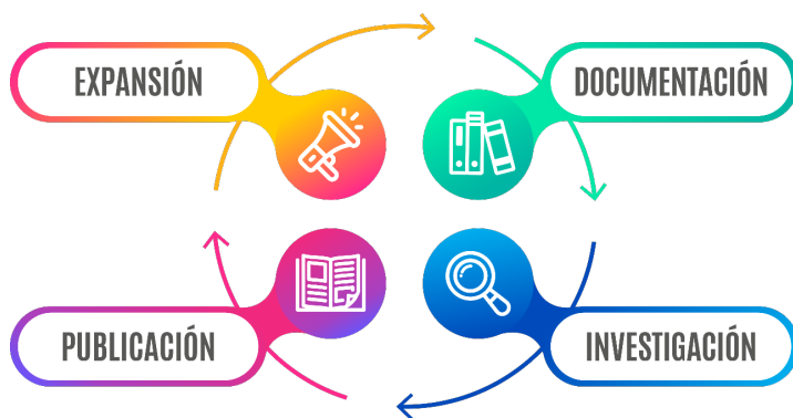
Figura 1. Modelo DIPE del ciclo de la comunicación científica

La metodología que se ha empleado para la elaboración del modelo DIPE se basó en dos técnicas de investigación clásicas: la revisión bibliográfica y el estudio de casos (Merlo, 2024). La revisión bibliográfica consistió en la obtención y el análisis de publicaciones sobre la implicación de las bibliotecas universitarias en los procesos de la comunicación científica. La