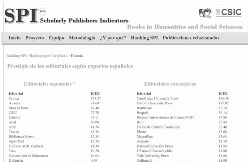
Fig. 11. SPI por Materia.

Nótese que algunas editoriales académicas aparecen en puestos destacados, como las del CSIC, la Universitat de València y la Universidad de Salamanca. Por tanto, a los clásicos indicios de calidad de una edición como estar revisada o ser competitiva —léase editorial privada—, la evaluación por expertos añade valores más sutiles.