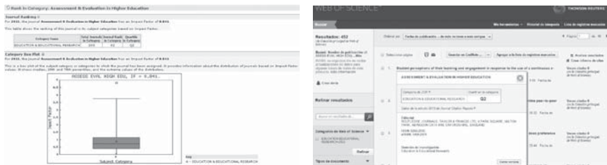
Fig. 8. Información Assesment & Evaluation in Higher Education desde JCR SSCI 2011 y SSCI 2013.

En segundo lugar solicitan la posición de la revista dentro de su área. En JCR se obtiene desde la página de una revista, pulsando el botón Journal Ranking . Ofrece la información sobre la posición y el área de la revista.