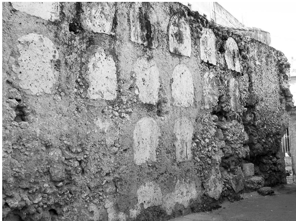
LÁMINA 2. Fragmentos del muro de nichos perteneciente al Cementerio General (Calles Aramburu y Vapor, Ciudad de La Habana).

Podemos decir que con estos y otros ejemplos se inició un período neoclásico dentro de la arquitectura cubana del siglo XIX que también tendría su incidencia en los palacios y casas privadas de la época, construcciones indispensables para entender la evolución de este estilo en Cuba y sus diversas variantes 43 .