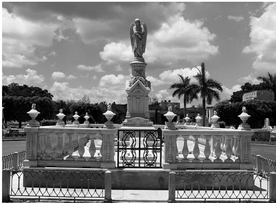
LÁMINA 3. Monumento al obispo Espada. Plaza de los Prelados. Cementerio de Colón, Ciudad de La Habana.

Este mausoleo perpetúa la memoria del obispo vasco que realizó aportes tan significativos a la cultura y la nación cubanas, cuyo ideario se cimentó en el espíritu ilustrado de las aulas de la Universidad de Salamanca en los últimos treinta años del siglo XVIII 55 , por donde, como aquí queda absolutamente demostrado, pasó en su juventud.