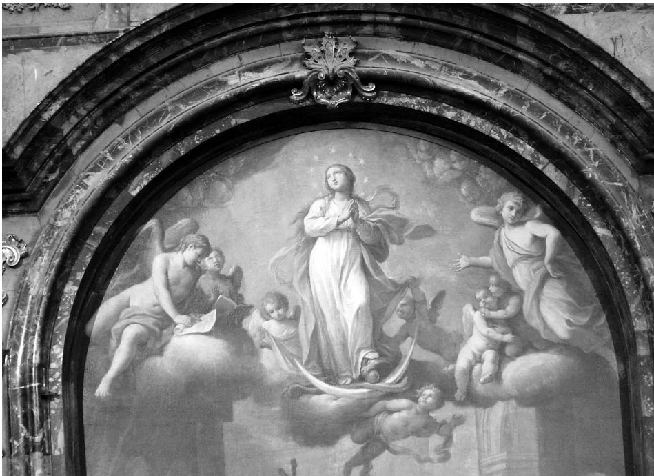
FIGURA 7. Caccianiga. Juramento... Inmaculada . Detalle.

Por encima del plano de los claustrales se ofrece la visión celeste de la Inmaculada, sobre la luna, pisoteando al dragón que tiene en sus fauces la manzana (fig. 7). Rodean a la Virgen ángeles, niños y adolescentes, en muy distintas actitudes, ya descansando, ya revoloteando, ya entonando canciones, con un aire muy rococó. La composición recuerda modelos muy diversos y anteriores, resonando en ella hasta ecos rafaelescos.