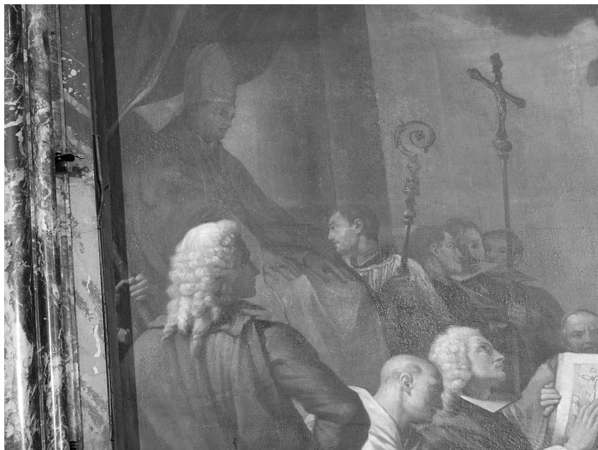
FIGURA 5. Caccianiga. Juramento de los claustrales . Detalle.