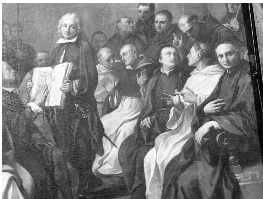
FIGURA 6. Caccianiga. Juramento de los claustrales . Detalle.