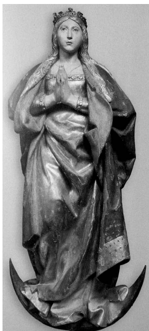
FIGURA 2. Felipe Bigarny. Inmaculada. Museo universitario.

La Inmaculada de Bigarny es una buena talla y una de las primeras esculturas que pueden colocarse bajo esa advocación mariana (fig. 2). La Virgen se alza sobre la media luna, con las manos juntas. Es una joven rubia de larga melena, absorta, de rostro un tanto idealizado. Ciñe corona y viste túnica dorada, adornada en escote y mangas con pedrería, y manto azul con orla también en oro. Esta tipología de María, de pie sobre la media luna, se mantendrá en la escultura y pintura del siglo XVII y posteriores.