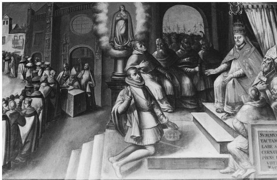
FIGURA 3. Lienzo del túmulo de Felipe III. Museo Universitario.

Del siglo XVII es uno de los lienzos que ornó la plataforma del túmulo levantado por la Universidad para celebrar las honras fúnebres de Felipe III, fallecido el 31 de marzo de 1621. El empeño religioso del monarca en la declaración del dogma de la Inmaculada (dogma proclamado por Pío IX el 8 de diciembre de 1854), junto con el juramento de los graduados, fue el motivo que la Universidad seleccionó para una de las pinturas que adornaban el túmulo levantado en el patio de las Escuelas Mayores. Con la elección de este episodio se destacaba un hecho importante de la vida del monarca ligado al Estudio y a la ciudad de Salamanca.