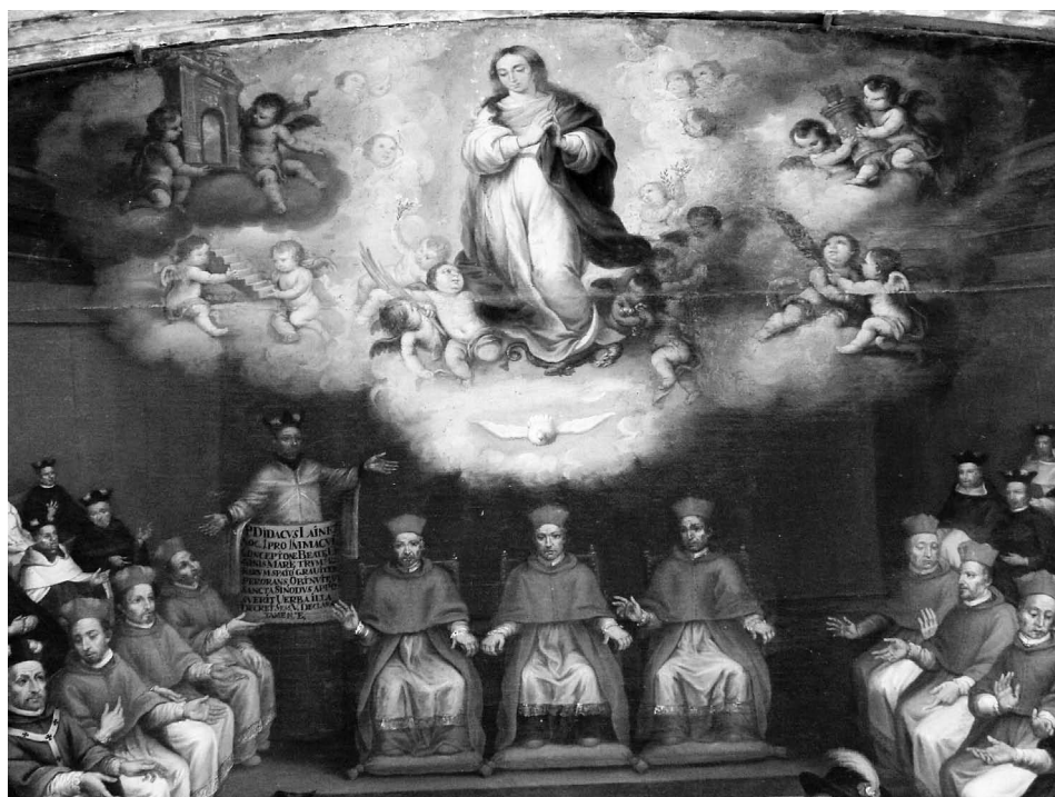
FIGURA 9. V sesi n del Concilio de Trento. Detalle. Universidad Pontificia.