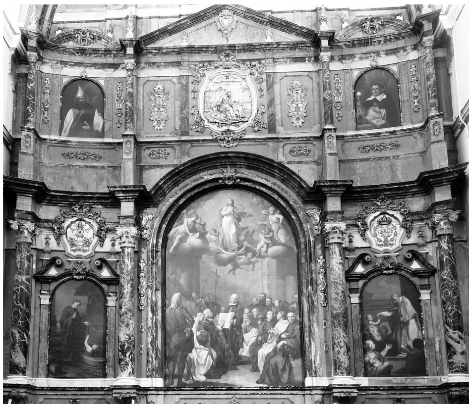
FIGURA 4. Retablo de la capilla universitaria.