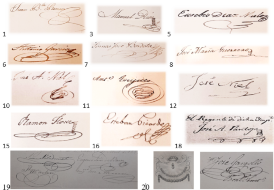
FIG. 1. Detalle de las firmas de los dueños y/o regentes de imprentas en Cádiz en 1834. AHPC, Gobierno Civil , caja 113, n.º 2.

Algo similar sucede en el caso de la imprenta de El Nacional (I-1839/30-VI-II-1855 y 1-VIII-1856/1856) 13 , que probablemente cambiase su denominación en 1843 por la de imprenta Liberal, pudiéndose explicar así la coincidencia en el emplazamiento.