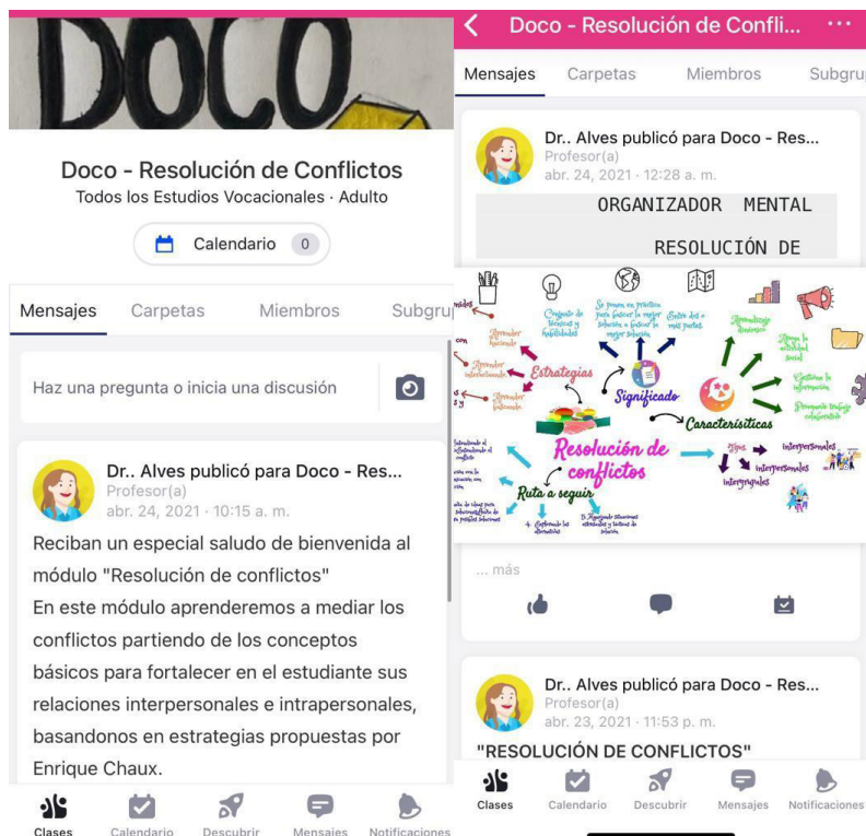
Figura 1. Vista general plataforma DOCO